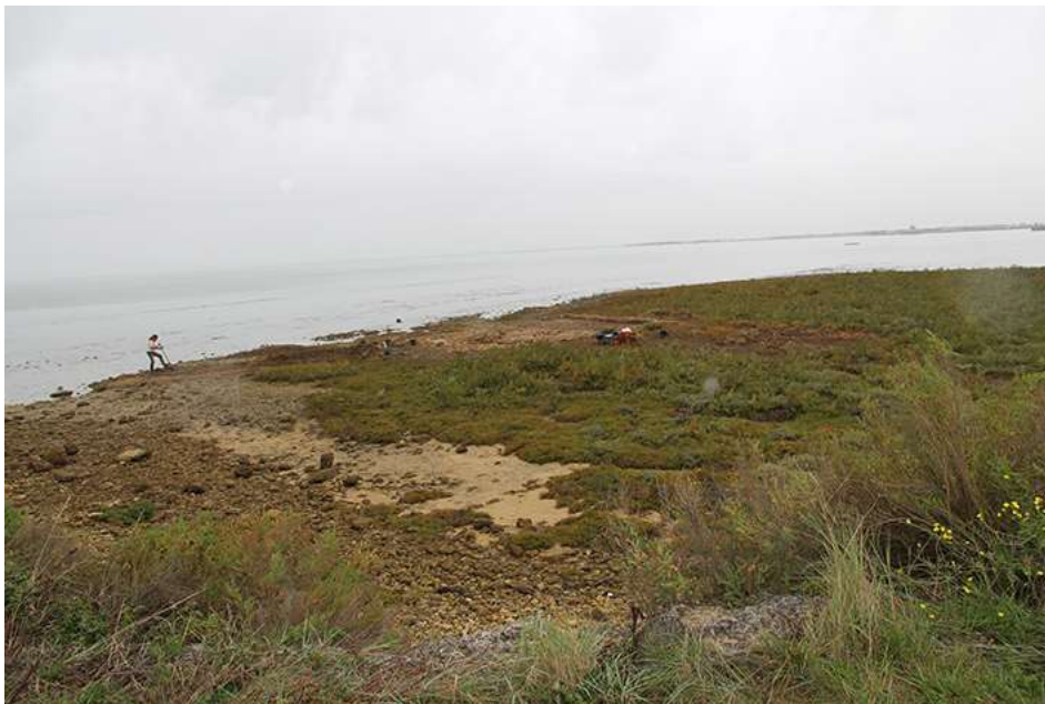
Le site d'Ors en cours de fouille.