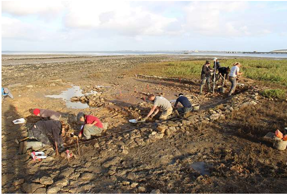
Le site d'Ors en cours de fouille (L. Soler, CD 17).