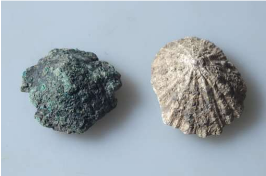
Patelle en bronze (à gauche) provenant du site de Mez Notariou à Ouessant