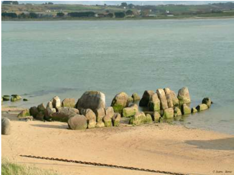
Site mégalithique de Kernic à Plouescat (Finistère).