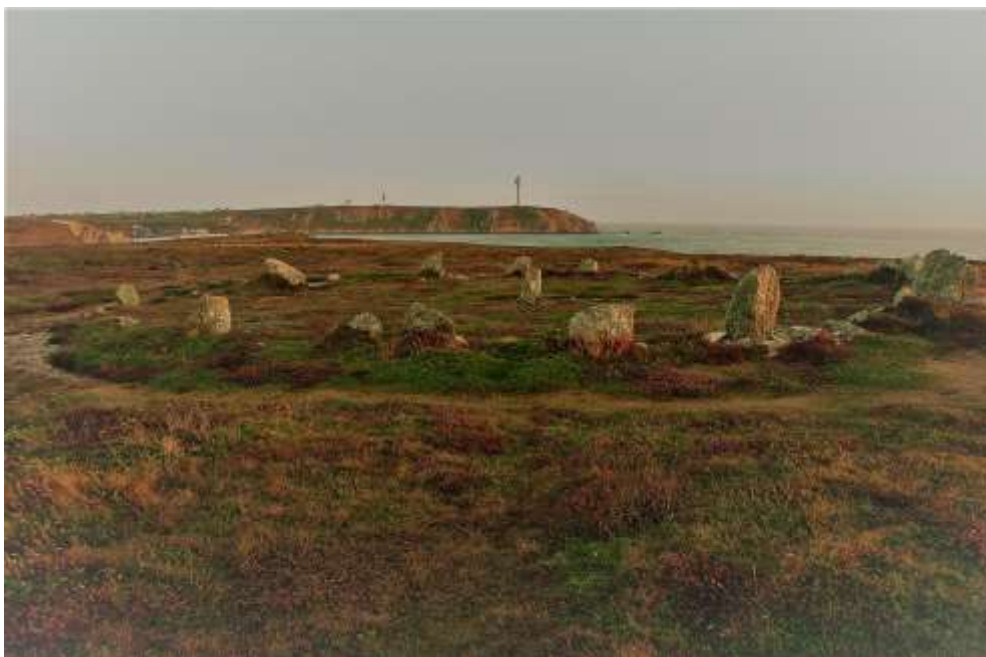
Le site de Pen ar Lann à Ouessant

Intervenant : Jean-Paul Le Bihan, professeur d'histoire –géographie, pratique l'archéologie depuis 1970 ; ses recherches sont consacrées à Quimper et à l'île d'Ouessant et il collabore également avec des archéologues du sud de la Russie. Il est l'auteur de nombreux ouvrages et a réalisé les expositions internationales « Au temps des Celtes » et « Rome face aux Barbares ».