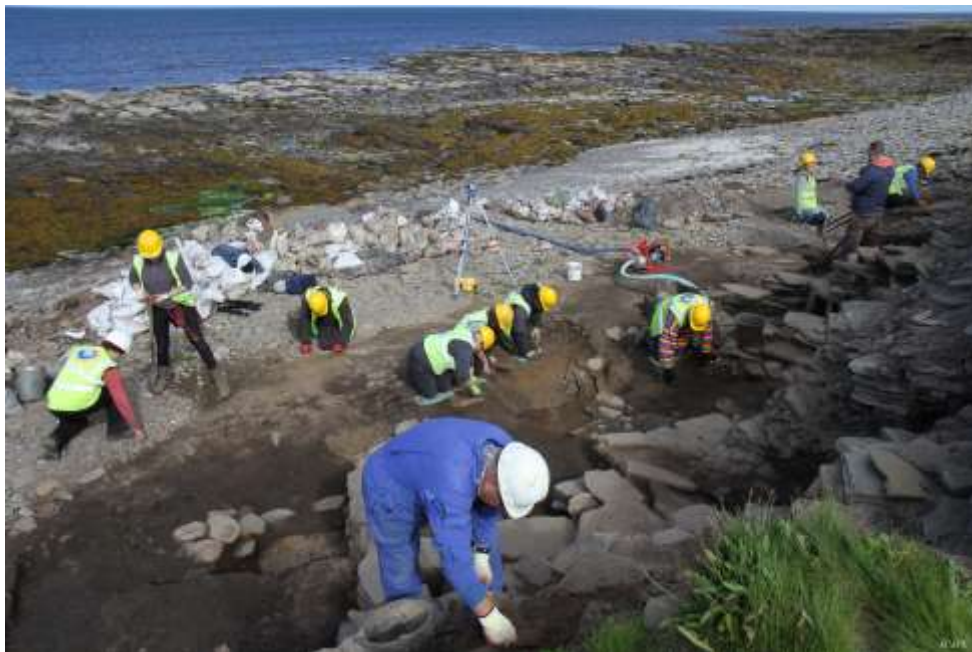
Intervention archéologique sur l'estran, Ecosse.