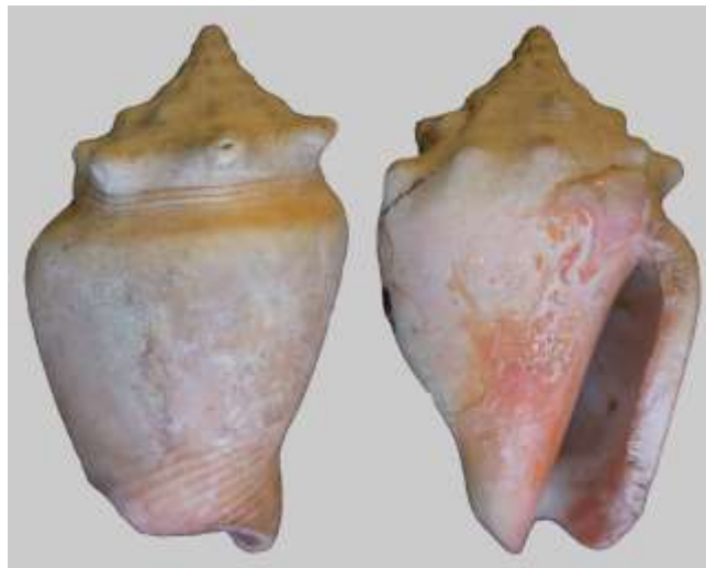
Strombus pugilis (L=66mm) du 17 ème de la Maison Champlain à Brouage.