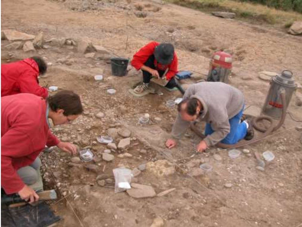
Fouille archéologique sur le site de Mez Notariou à Ouessant