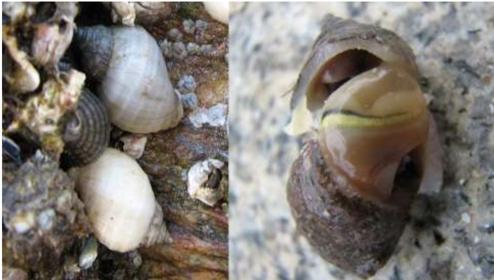
Le pourpre, espèce inféodée aux rochers possède une glande hypobranchiale (en jaune à droite) aux propriétés tinctoriales (C. Dupont).