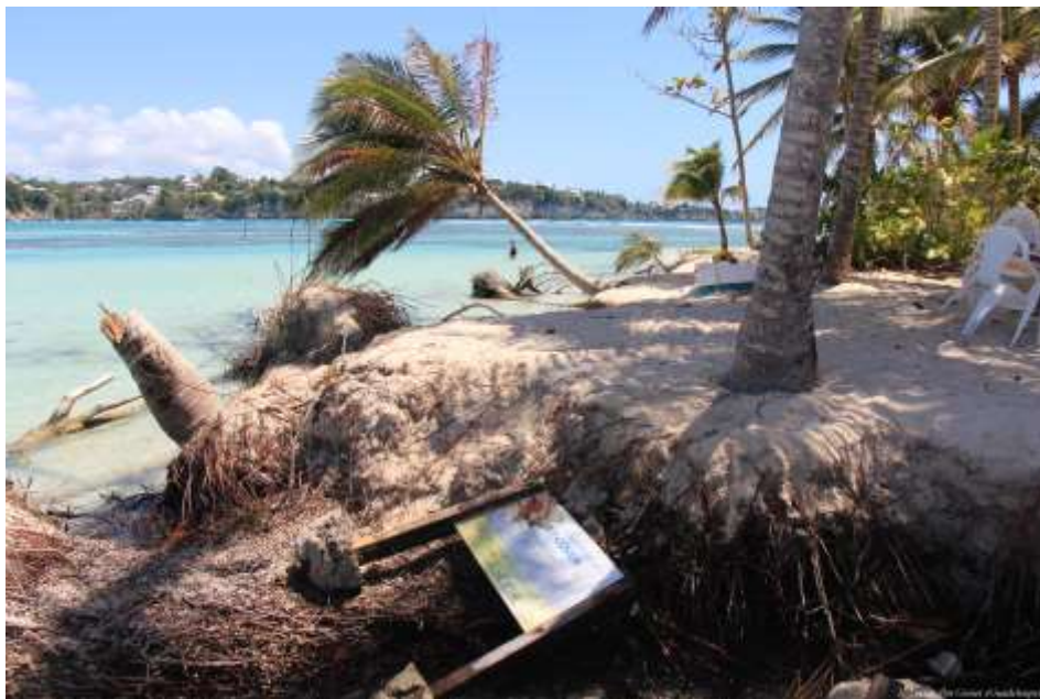
Îlot Gosier, Guadeloupe après le cyclone Irma.